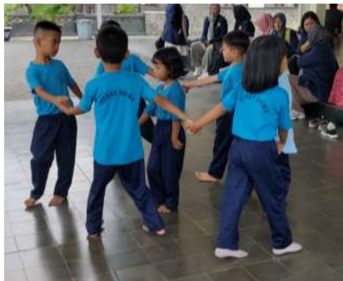
Gambar 5. Anak-anak bermain jamuran sambil bernyanyi

Tembang dolanan yang selanjutnya adalah jamuran , anak-anak bernyanyi sekaligus bermain. Adapun lirik dari tembang dolanan ini adalah jamuran y age ge thok, jamur apay a ge ge thok, jamur gajih mbejijih sak ara-ara sira mbadhe jamur apa ?