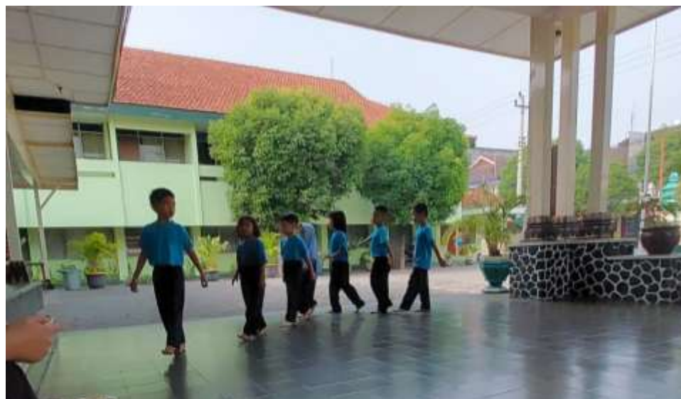
Gambar 3. Anak-anak meyanyikan Lagu sepuran

Dilanjutkan dengan anak-anak menyanyikan lagu sepuran gerak ini anak lakukan dengan menirukan sepur/ kereta yang sedang melaju. Judul lagu dari tembang dolanan ini adalah kuk-kuk-kuk ( sepuran ). Adapun lirik adalah kuk kuk kuk jes jes jes kuk kuk kuk jes jes jes sepur langsing maju mundur sepur langsing maju mundur tet tet tet tet jenggleng tet tet tet tet jenggleng jes jes jes jes jes jes kuk jes jes jes jes jes jes kuk .