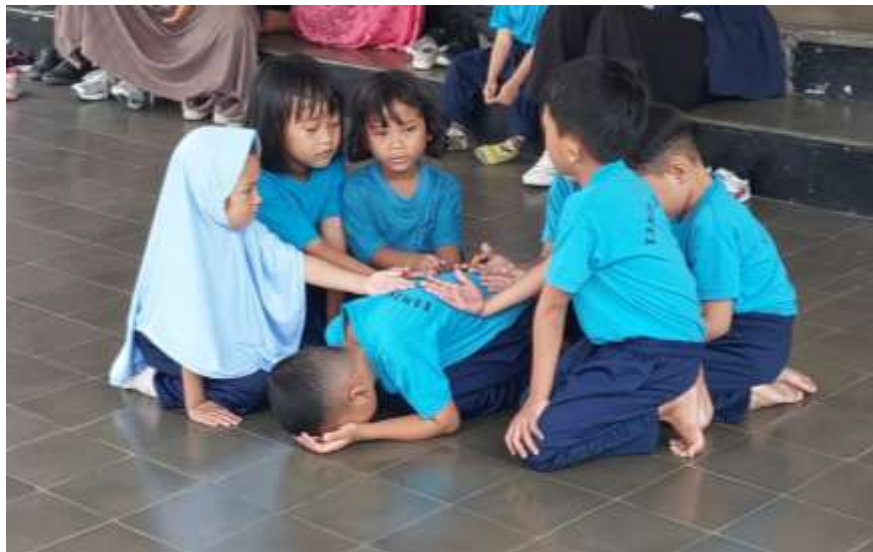
Gambar 2. Bermain dan nembang cublak-cublak suweng

gudel pak empo lera lere sopo nguyu ndeleake sir sir pong dele kopong sir sir pong dele kopong.