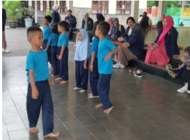
Gambar 4. Anak-anak bernyanyi gerak dan lagu gundul-gundul pacul

Lagu dolanan selanjutnya adalah tentang lagu gundul-gundul pacul anak-anak bernyanyi disambi gerak disesuaikan dengan lirik. Adapun lirik dalam lagu gundul-gundul pacul adalah gundul-dundul pacul-cul gembelengan nyunggi nyunggi wakul-kul gembelengan wakul ngglimpang segane dadi sak ratan wakul nggimpang segane dadi sak ratan ana bocah gundul lungo menyang sawah nyunggi-nyunggi wakul karo gembelengan mlaku ning tengah ndalan ora wedi bebayan wakule nglimpang dadi saklatar aja nangis ndul mbokndaktambah gundul ana nangis ndul mbokndak tambah gundul.